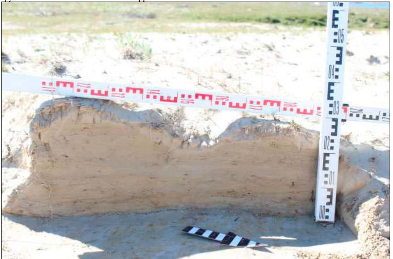
Рис. 328. Фото. Тюменская область. ЯНАО. Ямальский район. Инвентаризация состояния объектов культурного наследия Ямальского района. 2018 г. Территория разрушенного памятника – стоянка Ярра-то 3. Стратиграфический разрез. Вид с севера.