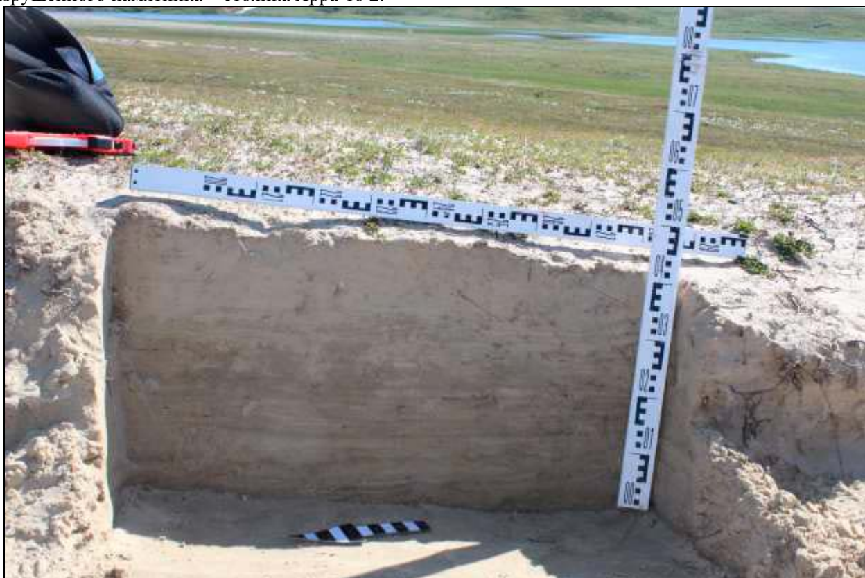
Рис. 321. Фото. Тюменская область. ЯНАО. Ямальский район. Инвентаризация состояния объектов культурного наследия Ямальского района. 2018 г. Территория разрушенного памятника – стоянка Ярра-то 2. Стратиграфический разрез. Вид с северо-запада.