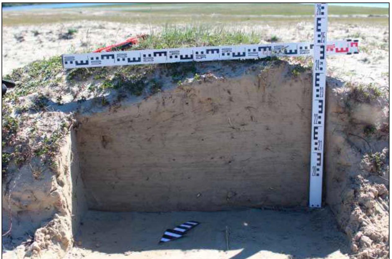
Рис. 314. Фото. Тюменская область. ЯНАО. Ямальский район. Инвентаризация состояния объектов культурного наследия Ямальского района. 2018 г. Территория разрушенного памятника – стоянка Ярра-то 1. Стратиграфический разрез. Вид с северо-запада.