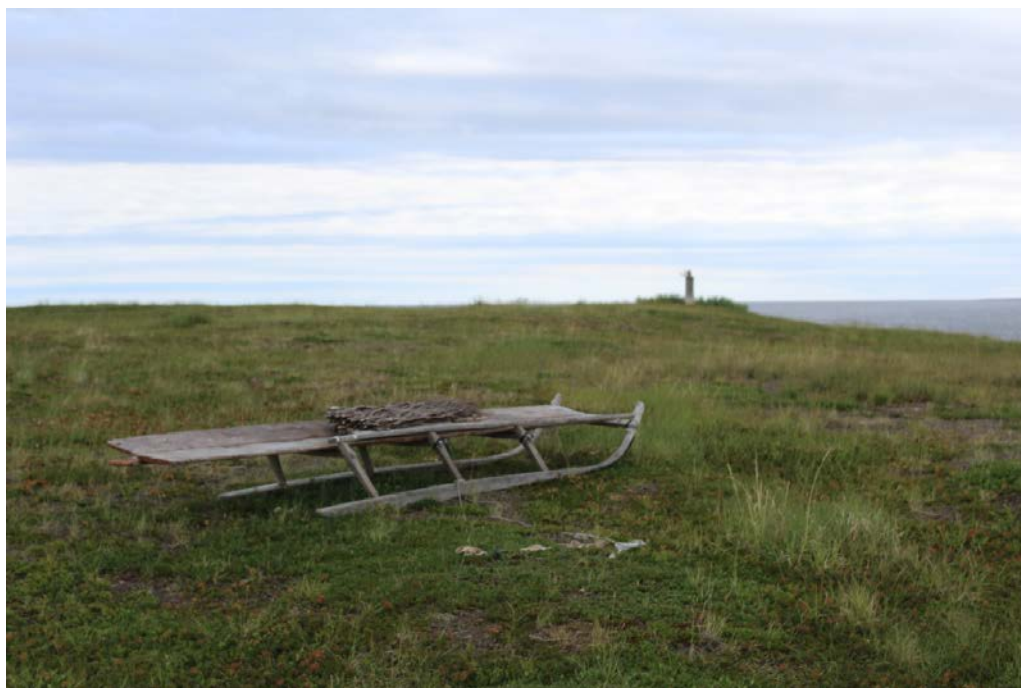
Стоянка Ярославейяха 1. Остатки стоянки кочевников на вершине мыса

Для обнаружения культурного слоя было выполнено три зачистки.