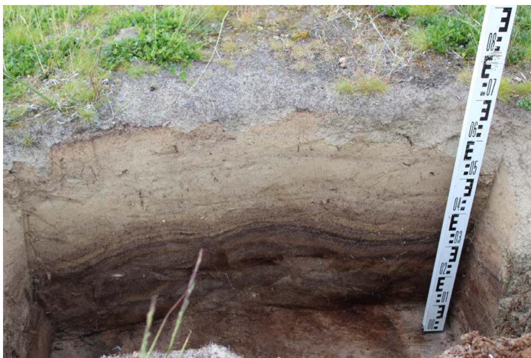
Стоянка Ярославейяха 1. Стратиграфический разрез 1

Стратиграфический разрез № 1 (зачистка № 1) выполнен на стенке выдува (координаты: N67°18'15,06", E72°04'23,40"). Глубина вскрытых отложений составила 0,65 м. В разрезе видно, что пачка чередующихся слоёв тёмно-серого и чёрного песков, мощностью до 0,4 м. (очевидно, результат эффекта пучения), перекрыта толщей светло-серого песка эолового генезиса (мощность 0,2-0,25 м).