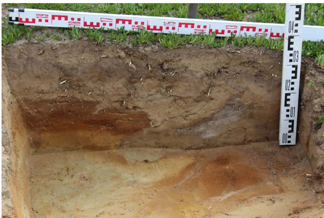
Стоянка Ярославейяха 1. Стратиграфический разрез 3

Стратиграфический разрез № 3 (зачистка № 3) выполнен на задернованной части площадки мыса (координаты N67°18'13,27", E72°04'11,31"). Глубина вскрытых отложений составила 0,35-0,4 м. Стратиграфия представлена естественными напластованиями: дёрн (мощность 0,01-0,02 м), слой серого песка – погребенная почва (мощность 0,02-0,025 м), слой серо-рыжего песка (до 0,20 см), слой ожелезненного материкового песка с линзой серо-черного перемеса – результат пучения (вскрыто до 0,2 м).