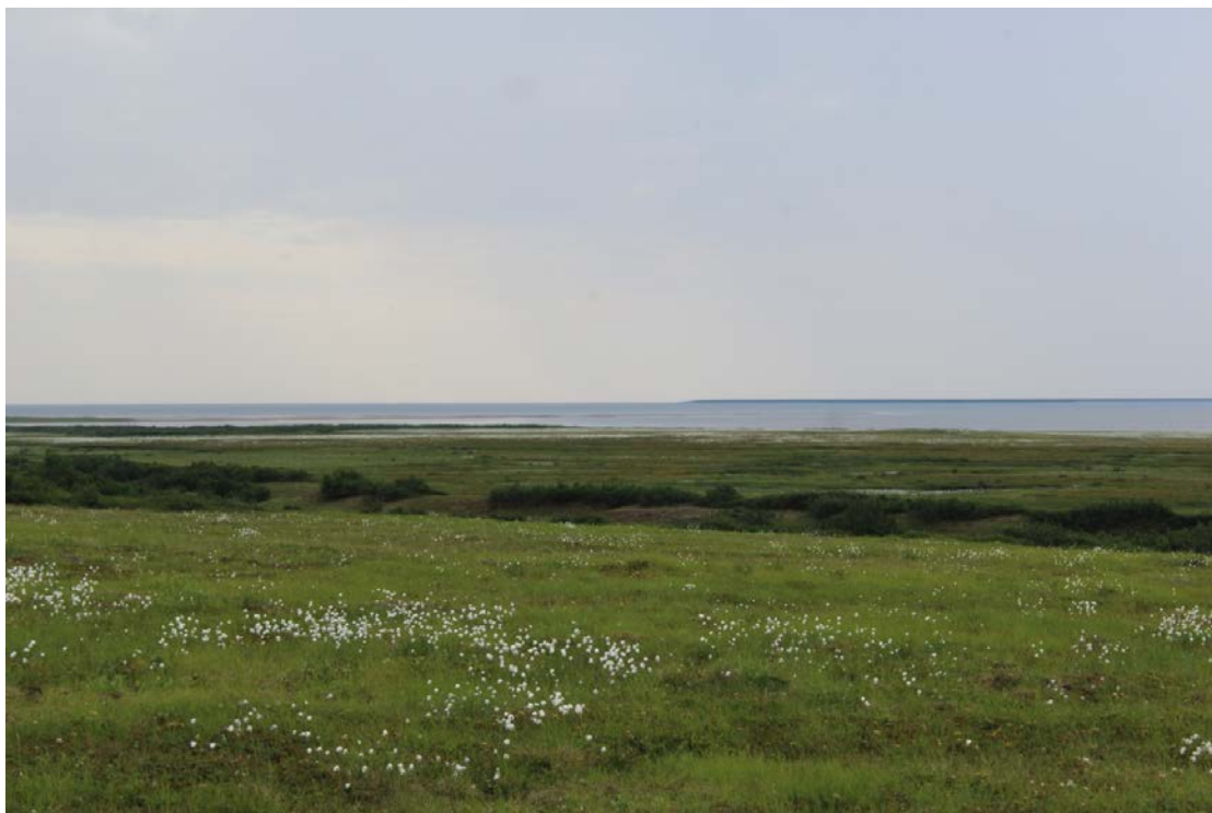
Устье р. Ярославля. Заболоченная местность без признаков наличия памятников культурного наследия. Вид с запада (левый берег реки)

Стоколоса. Мы приняли решение соотнести его с тем самым озером, о котором и говорится в отчете.