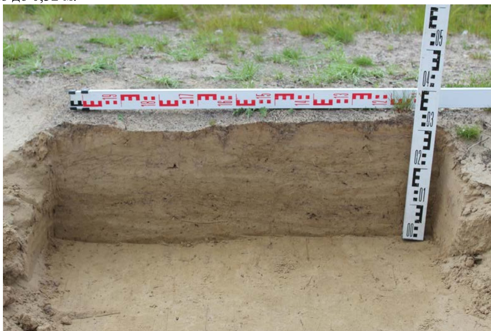
Стоянка Ярославейяха 1. Стратиграфический разрез 2

Стратиграфический разрез № 2 (зачистка № 2) выполнен на краю выдува (координаты N67°18'13,13", E72°04'18,49"), вскрыта эоловая толща светло-серого песка, мощностью до 0,32 м.