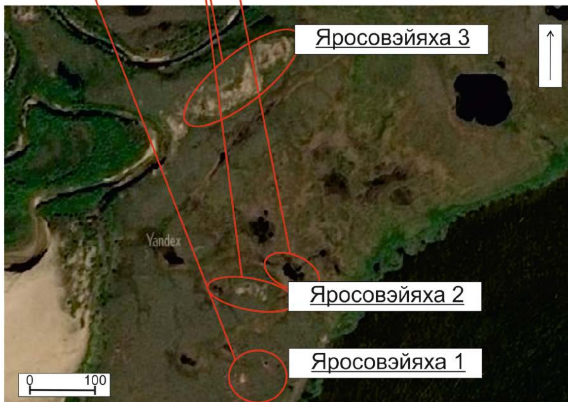
Соотнесение плана 1998 г. с реальными космическими снимками