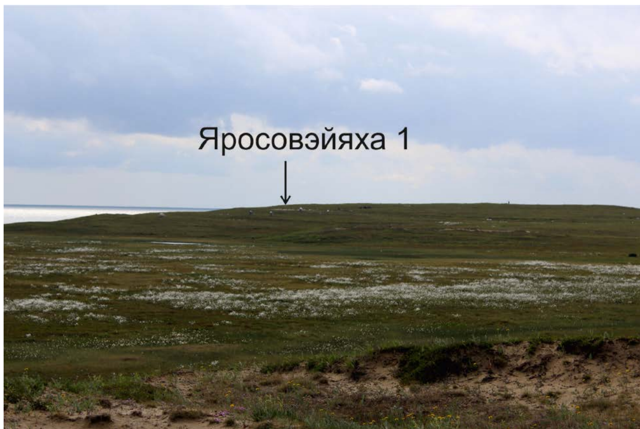
Стоянка Ярославейяха 1. Вид на мыс и стоянку современных кочевников с площадки стоянки Ярославейяха 3

В 2018 г. была проведена инвентаризация состояния выявленного объекта археологического наследия исследовательским отрядом ООО «Ямальская археологическая экспедиция» под руководством И.К. Новикова и Н.В. Перцева. Обследован высокий мыс южной части Бухты Находка, на котором ранее была обнаружена стоянка. Мыс сложен глинистыми породами, площадка мыса относительно ровная, сильно потрескалась вследствие криогенных процессов.