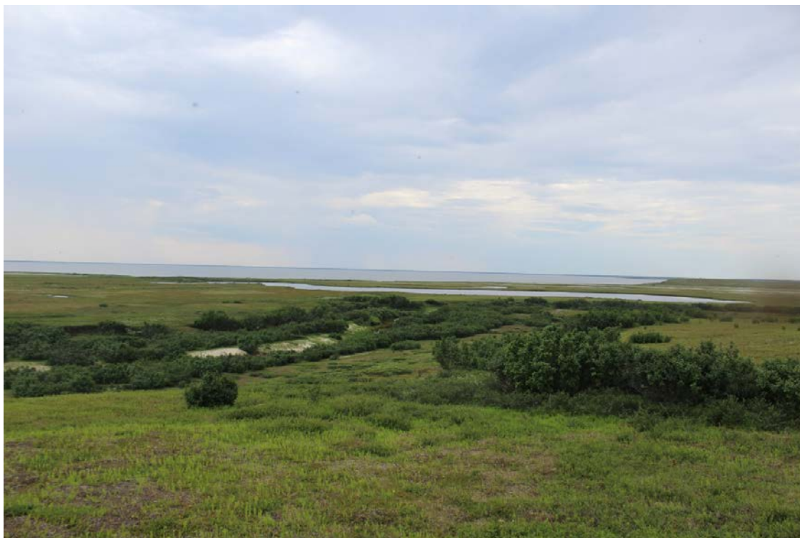
Устье р. Ярославля. Вид на мыс и заболоченное озеро, взятое за ориентир в 1998 г. Вид с северо-запада