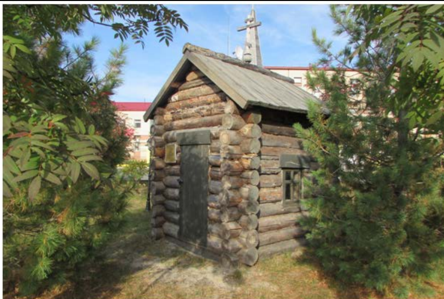
Фото 7. Крупный план объекта культурного наследия регионального значения памятник «Часовня, район левобережья реки Ярудей, 1901 г.». Видовое раскрытие объекта. Вид с ЮЗ. Шаг 7. Ю.В. Кутас, 2018.