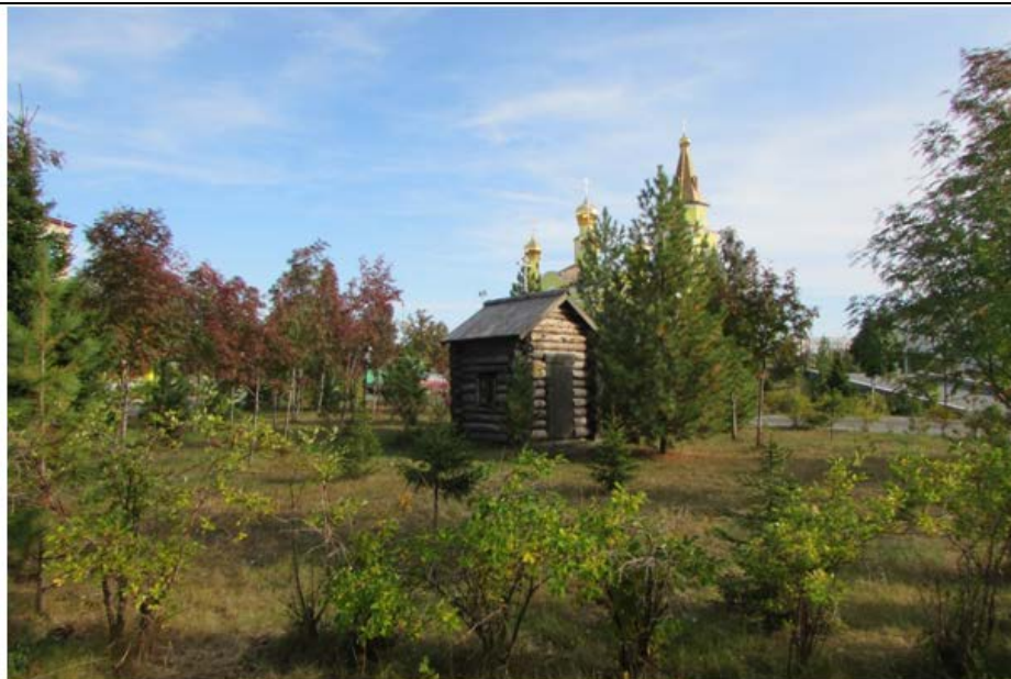
Фото 12. 11 м до объекта культурного наследия регионального значения памятник «Часовня, район левобережья реки Ярудей, 1901 г.». Вид после ограды храма. Видовое раскрытие объекта. Вид с СЗ. Шаг 5. Ю.В. Кутас, 2018..