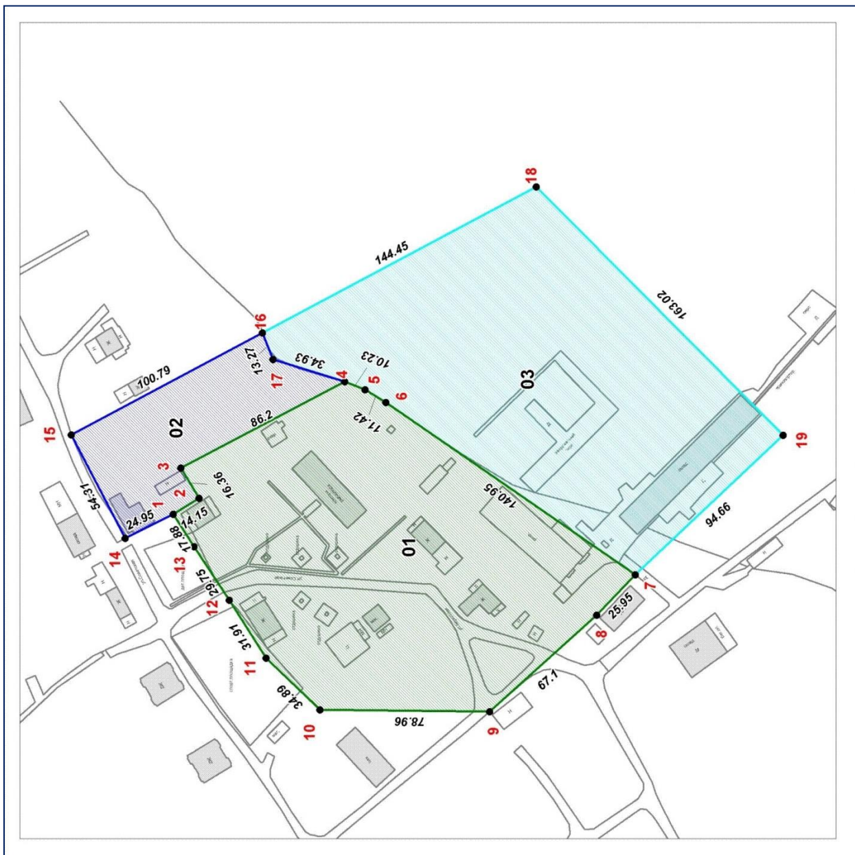
Схема расположения границ зоны охраняемого природного ландшафта объекта культурного наследия регионального значения «Сооружение «Мерзлотник»