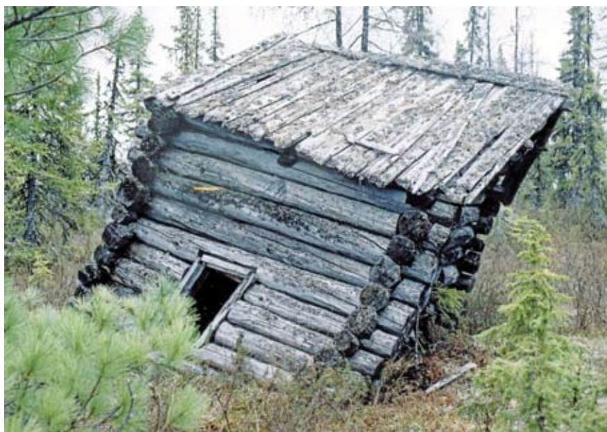
Часовня. Вид с севера. 2006 год

Часовня по внешнему облику относится к простейшей разновидности культовой постройки клетского типа, отличается традиционной техникой строительства. Она представляет собой невысокий квадратный в плане сруб размером около 2,4 x 2,4 метра, сложенный из нетолстых брёвен хвойных пород диаметром 16 – 18 сантиметров, проложенных мхом. Поставленная прямо на землю постройка крыта двускатной жердевой крышей, скреплённой коньком и покрытой тёсом. Единая монолитная масса сруба соединяется с кровлей через рубленые фронтоны, которые являются непосредственным продолжением стены по коротким сторонам, с постепенным уменьшением брёвен с двух сторон.