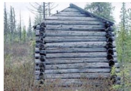
Восточная глухая стена часовни