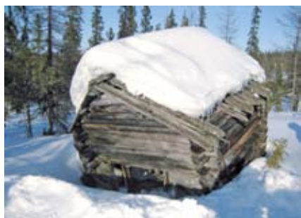
Общий вид на часовню с запада