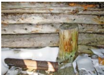
Пень внутри часовни у восточной стены