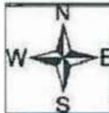
Схема расположения скважины №294