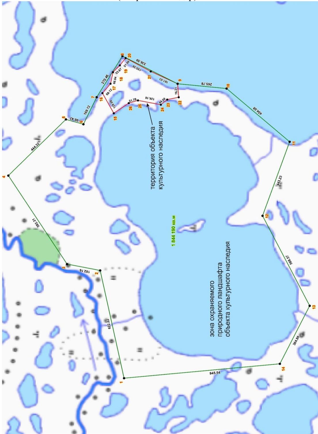
Схема расположения границы зоны охраняемого природного ландшафта объекта культурного наследия регионального значения достопримечательное место «Священное место Кан-то (Озеро Божий дар)»