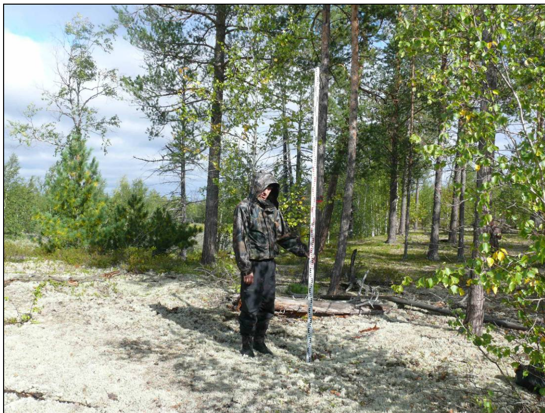
Фото 1. Вид на остатки сооружения №4 выявленного объекта археологического наследия «Поселение Вынгаяха 1». Снято с юга.