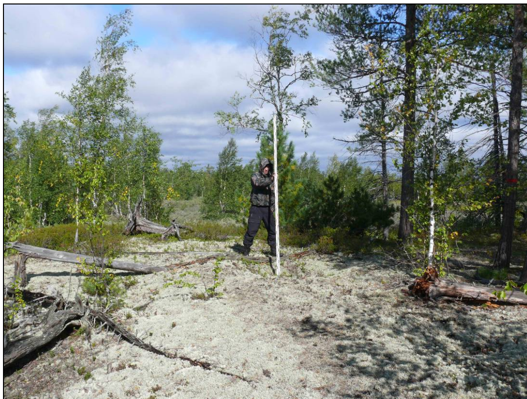
Фото 2. Вид на остатки сооружения №2 выявленного объекта археологического наследия «Поселение Вынгаяха 1». Снято с юго-востока.