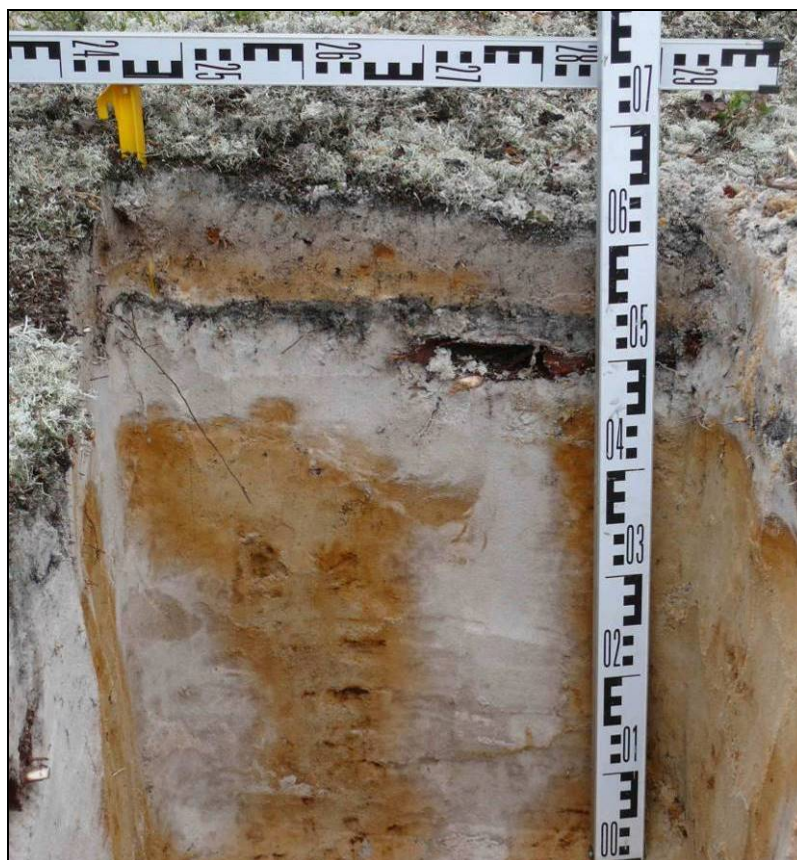
Фото 4. Культурный слой эпохи средних веков, зафиксированный в жилище 2 на территории выявленного объекта археологического наследия «Поселение Вынгаяха 1». Снято с юга.