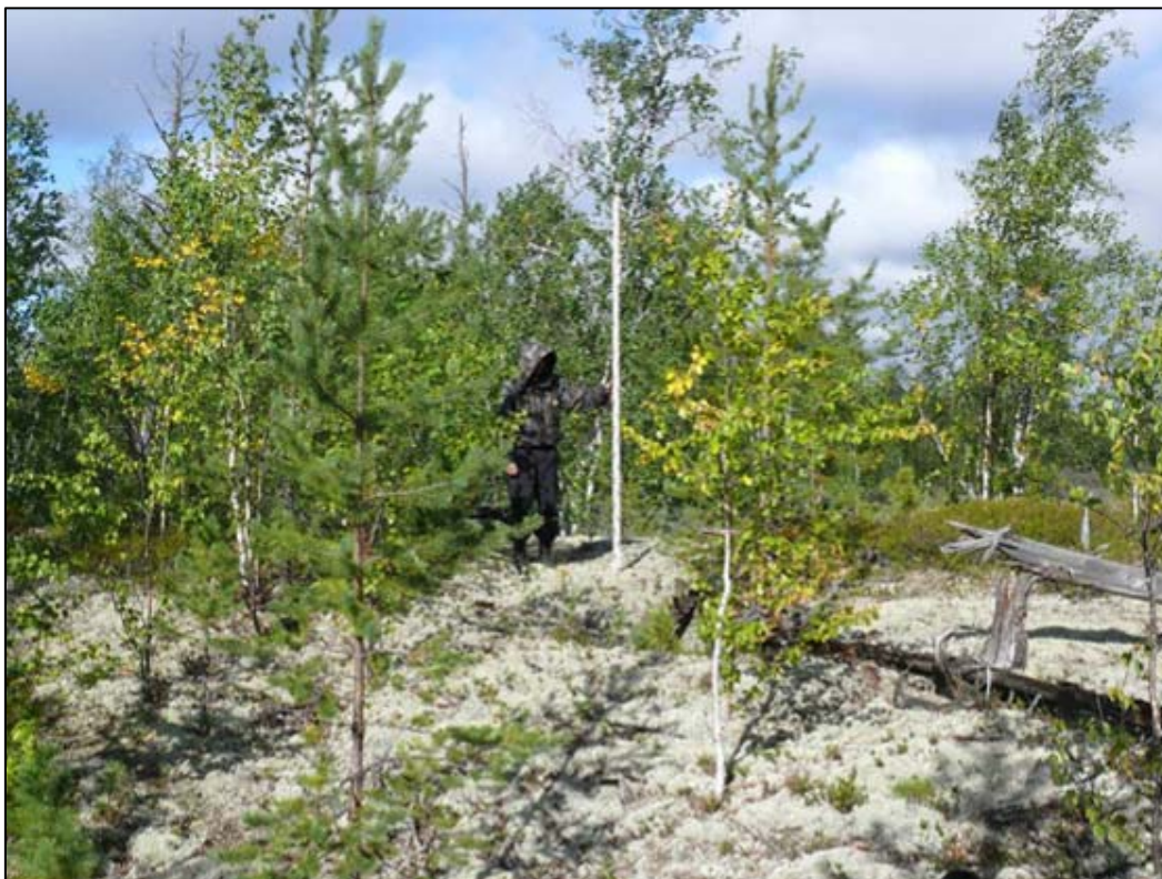
Фото 3. Вид на остатки сооружения №1 выявленного объекта археологического наследия «Поселение Вынгаяха 1». Снято с юго-запада.