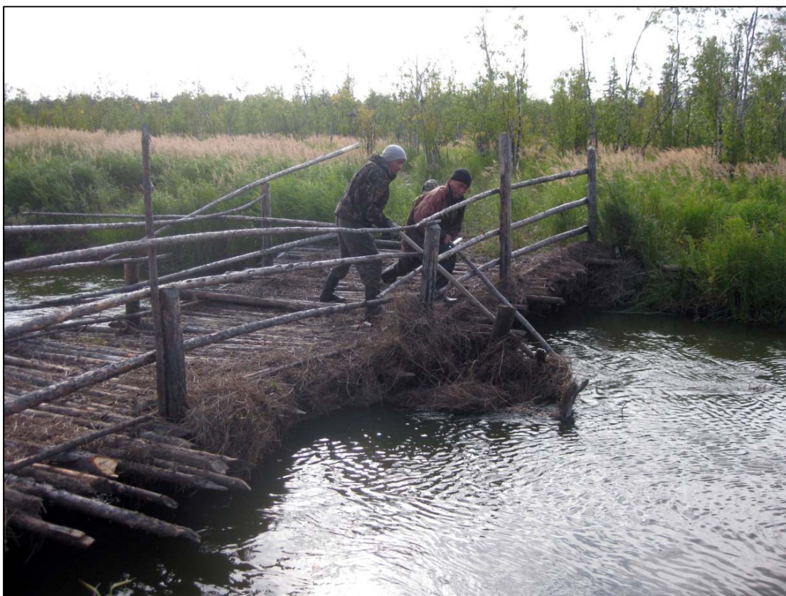
Фото 4. «Священное место Тояй-щу пулняна (Дыхание Небесного озера)». «Очищение дыхания озера» хранителями места. На фото Пяк Константин Авалевич и Геннадий Авалевич