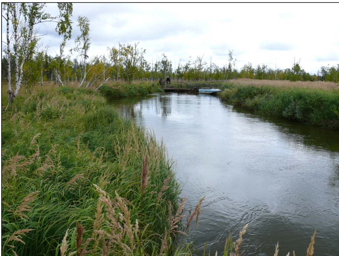
Фото 1. Общий вид объект, обладающего признаками объекта культурного наследия «Священное место Тояй-шу пулняна (Дыхание Небесного озера)». Снято с востока.