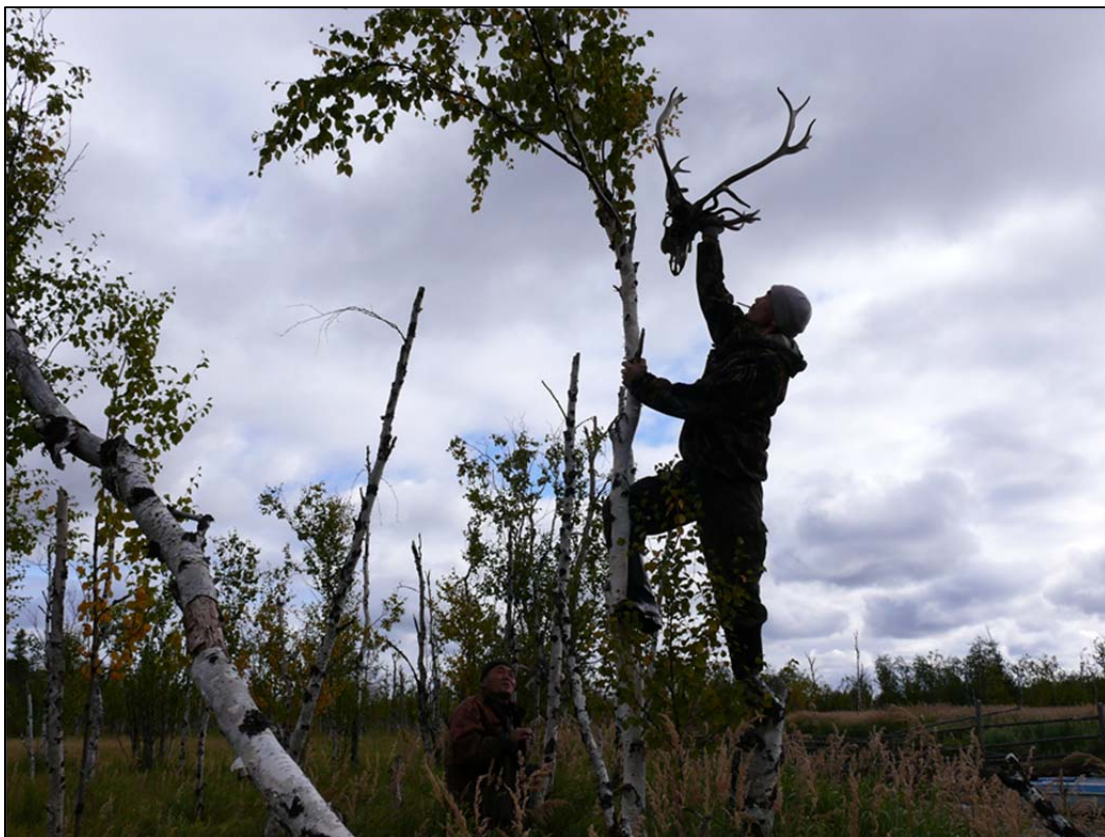
Фото 3. «Священное место Тояй-щу пулняна (Дыхание Небесного озера)». Поднятие упавшего черепа хранителем места. На фото Пяк Константин Авалевич.