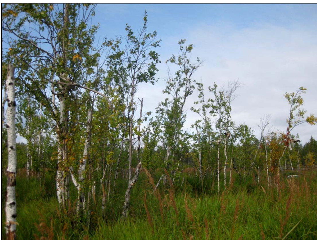
Фото 2. «Священное место Тояй-шу пулняна (Дыхание Небесного озера)». Жертвенные подношения на берегу. Снято с юга.