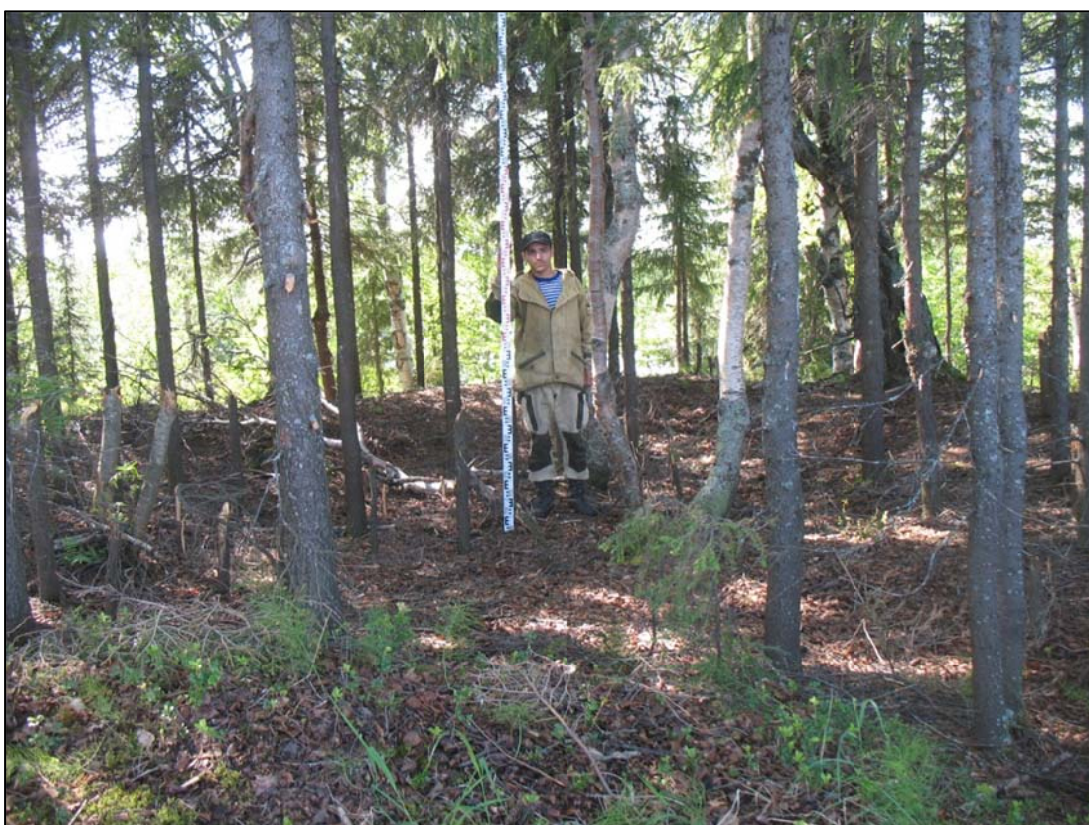
Фото 2. Остатки строения средних веков (площадка 8) на территории выявленного объекта археологического наследия «Городище Усть-Васьеган 1». Снято с юга.