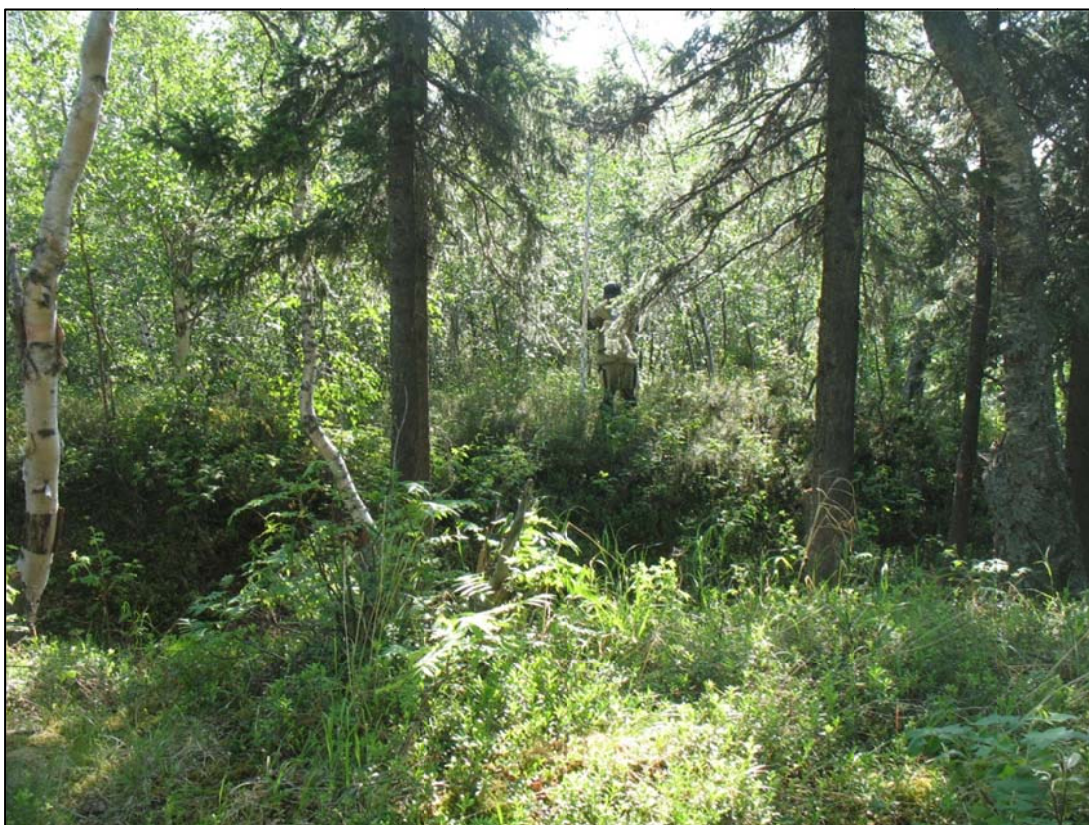
Фото 1. Остатки оборонительных сооружений выявленного объекта археологического наследия «Городище Усть-Васьеган 1». Снято с юго-запада.