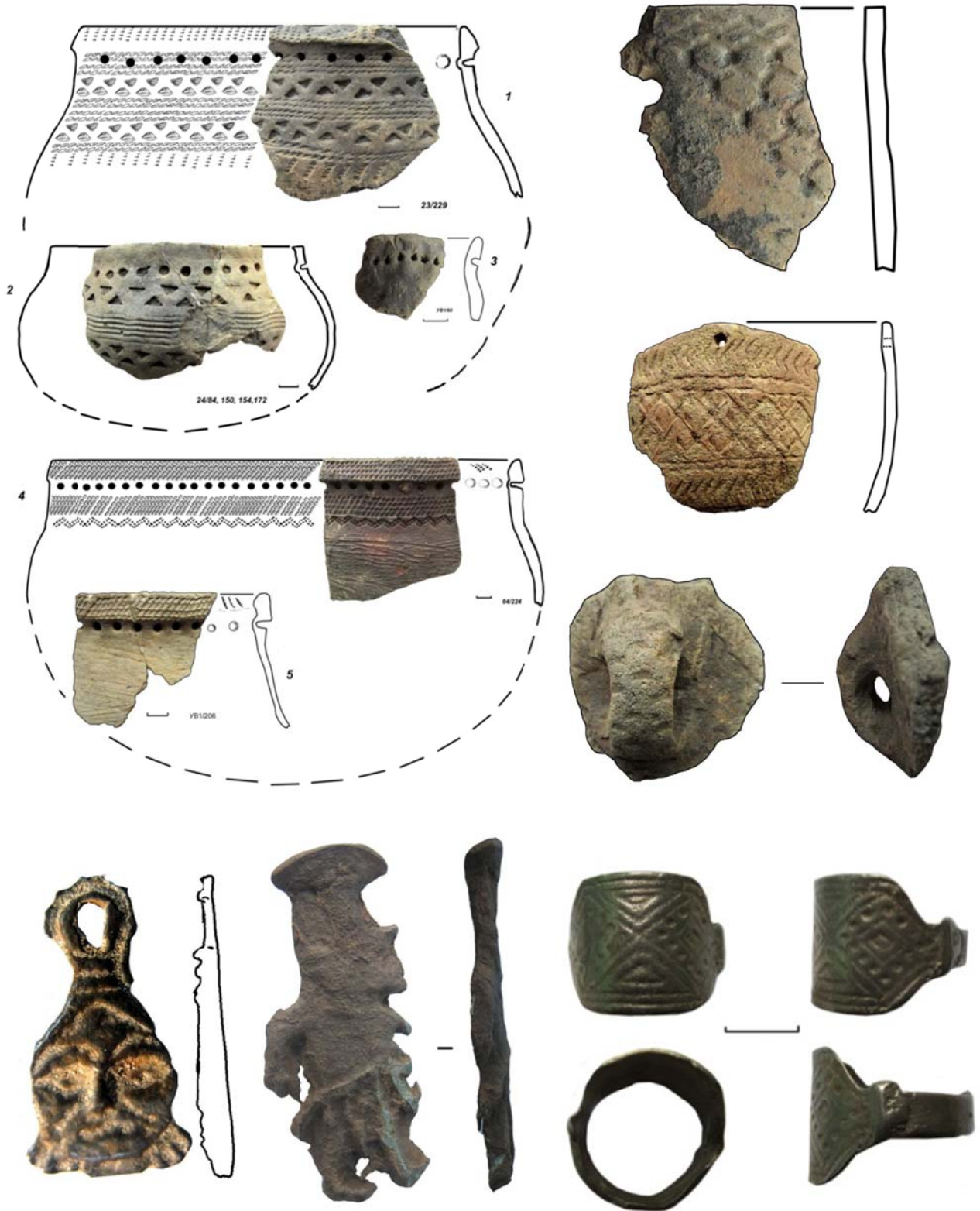
Фото 3. Артефакты, собранные в раскопах на территории выявленного объекта археологического наследия «Городище Усть-Васьеган 1» (фрагменты керамических сосудов, антропоморфные изображения и перстень из сплава цветных металлов).