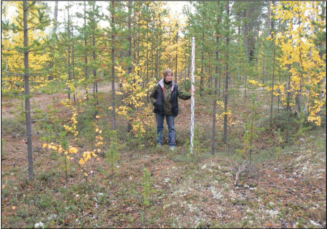
3. - « ( 2) - ».