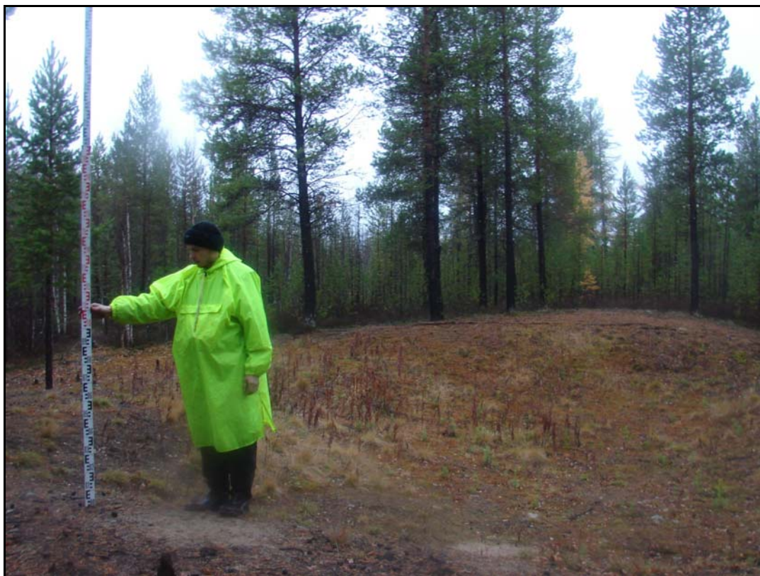
Фото 1. Вид на раскоп 2 выявленного объекта археологического наследия «Поселение Лов-Санг-Хум 2». Снято с юга.