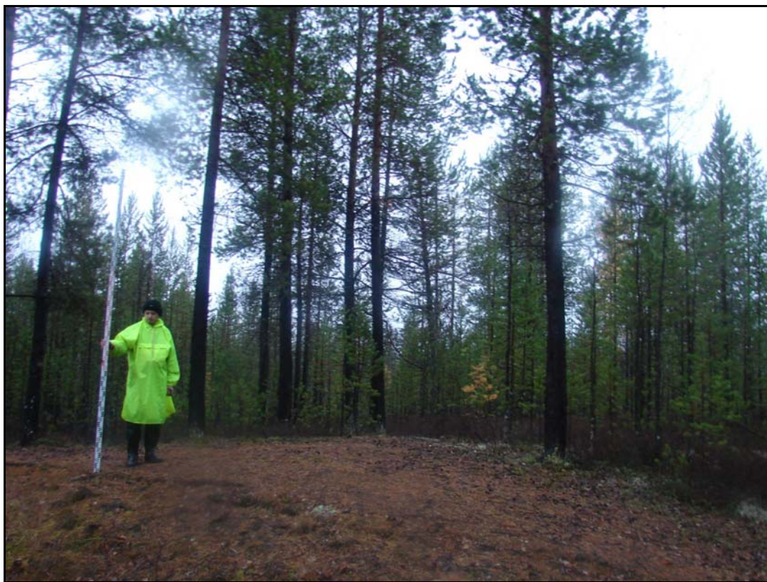
Фото 2. Вид на раскоп 2 выявленного объекта археологического наследия «Поселение Лов-Санг-Хум 2». Снято с запада.