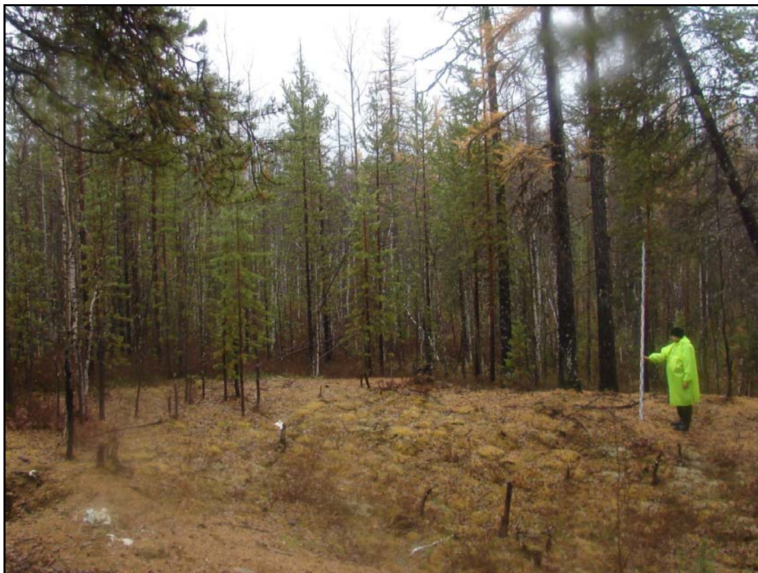
Фото 3. Вид на межжилищное пространство объекта археологического наследия «Поселение Лов-Санг-Хум 2». Снято с востока.