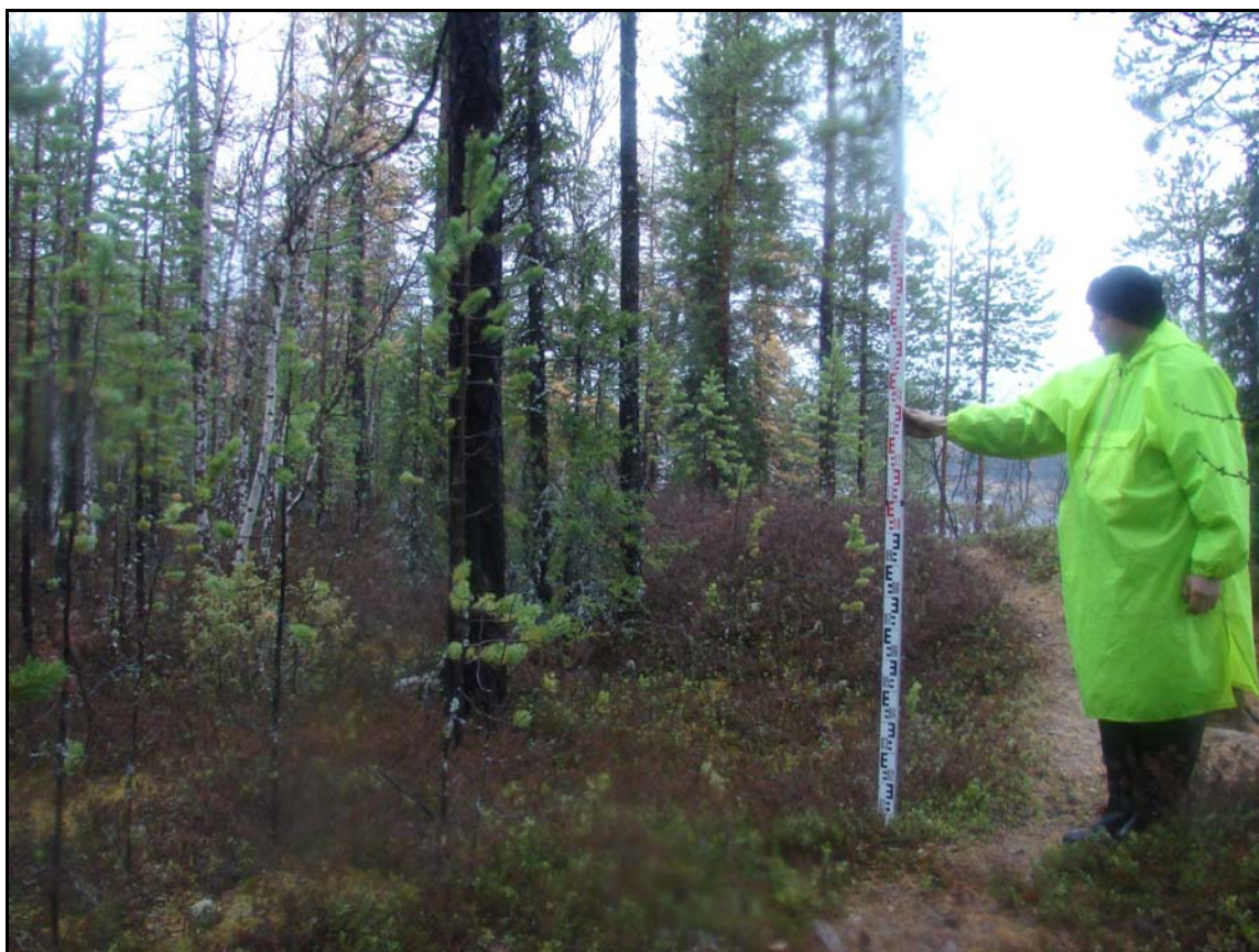
Фото 3. Вид на остатки сооружения №3 выявленного объекта археологического наследия «Поселение Лов-Санг-Хум 1». Снято с востока.