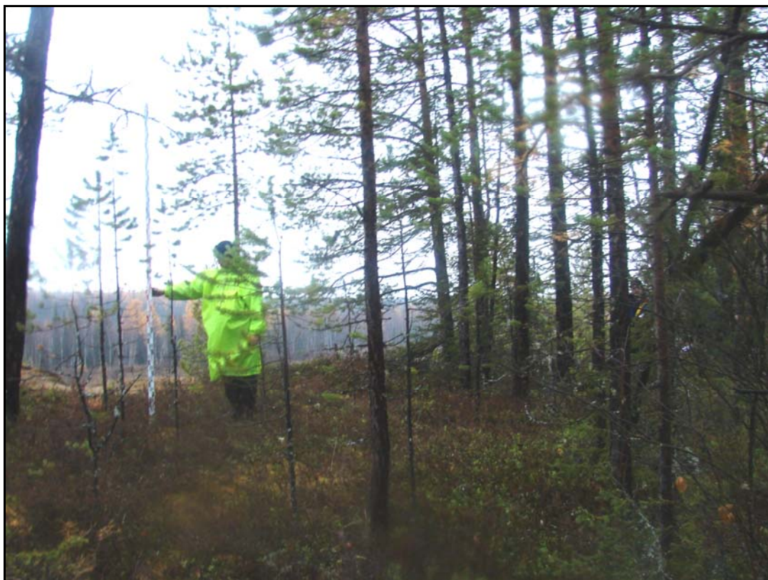
Фото 1. Общий вид выявленного объекта археологического наследия «Поселение Лов-Санг-Хум 1». Снято с востока.