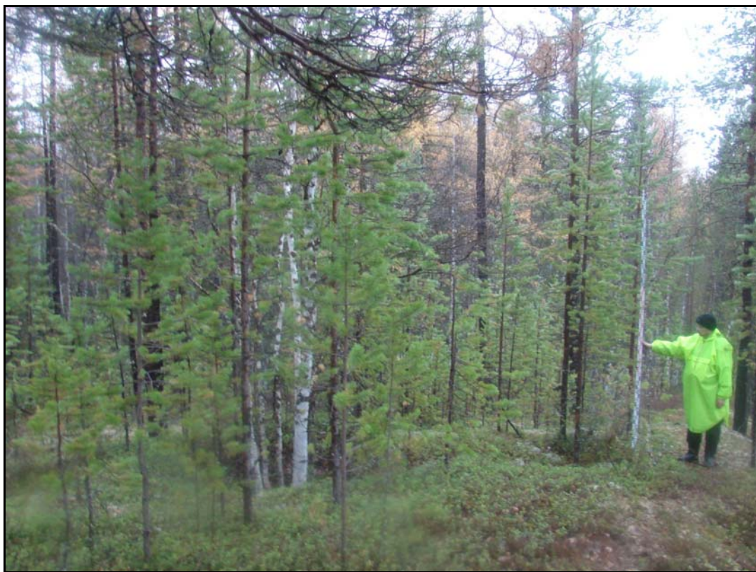
Фото 2. Вид на остатки сооружений №6 и 7 выявленного объекта археологического наследия «Поселение Лов-Санг-Хум 1». Снято с севера.