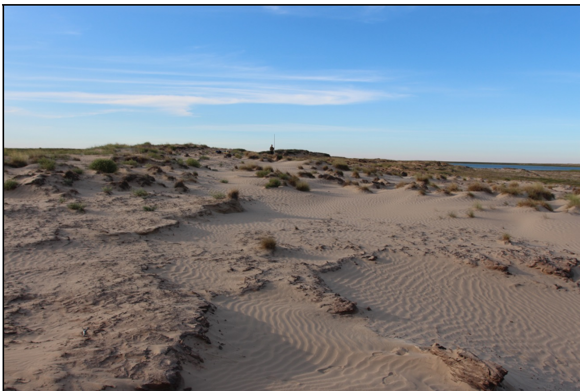
Фото 1. Выдув на месте выявленного объекта археологического наследия «Поселение Юньяха 1». Снято с юга.