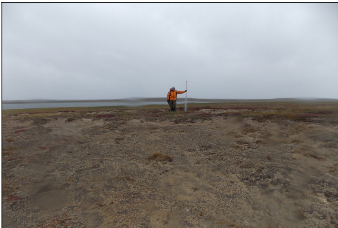
Фото 1. Видув на месте выявленного объекта археологического наследия «Стоянка Найтосе б». Снято с запада.